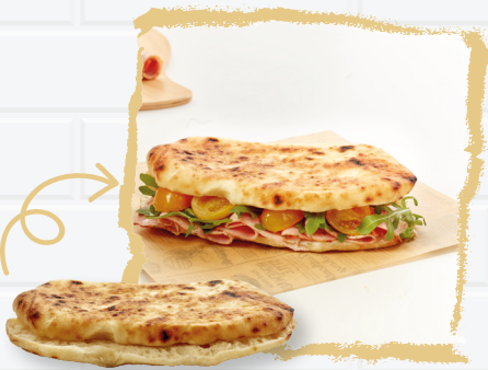
Panuozzo di gragnano