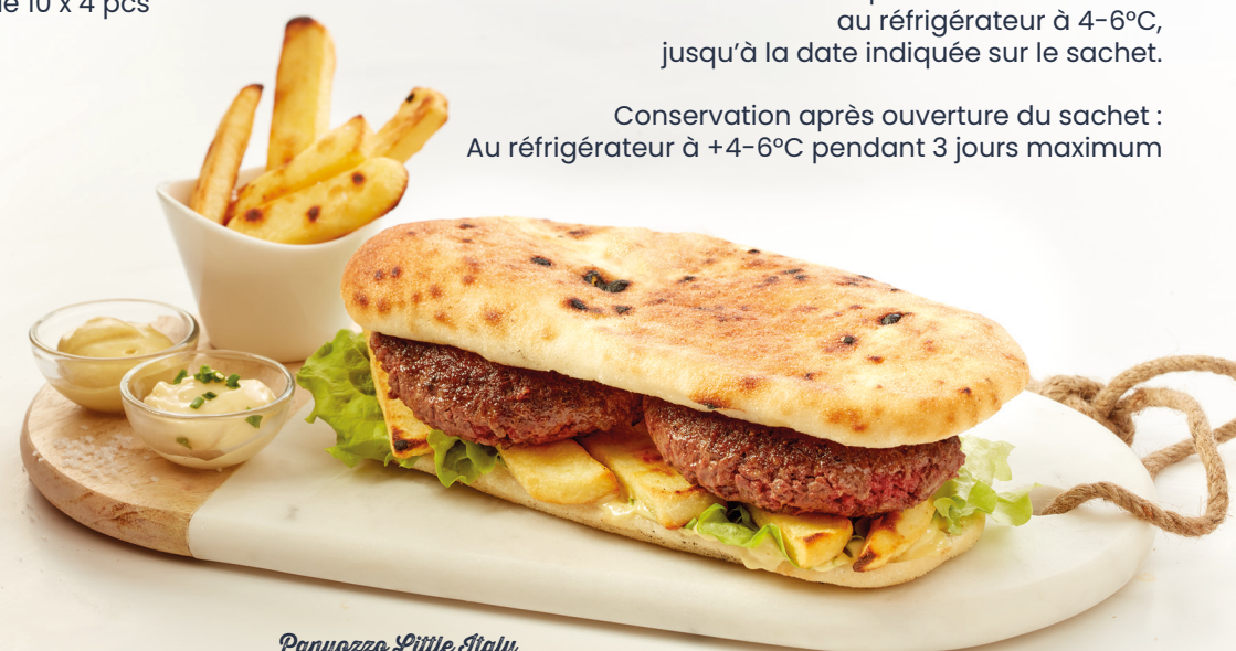
Panuozzo Little Italy